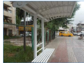
Programa compensación extensión uso TNE

29 Adquisición de Activos No Financieros: comprende los gastos correspondientes a la adquisición de terrenos, edificios, vehículos, mobiliarios, equipos y programas informáticos que la institución requiera.