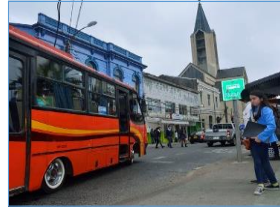
Subsidio a la oferta en zonas no reguladas