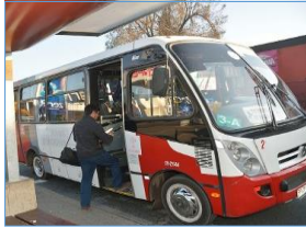
Subsidio a la oferta en zonas reguladas