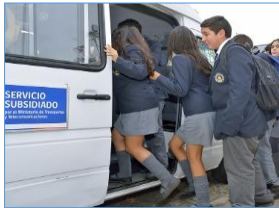
Subsidio al transporte escolar