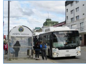
Subsidio al transporte en zonas extremas