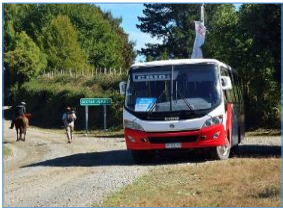
Subsidio al transporte público para la conectividad de zonas rurales