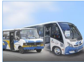
Subsidio para modernización transporte público