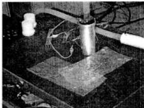
Ilustración 2: Generador de Ozono