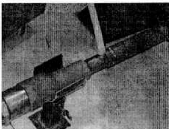
Ilustración 3: Punto de inyección a los gases de escape.